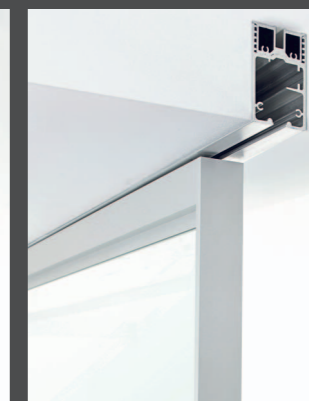
Particolare binario a 1 via incassato nel soffitto Detail 1 way built-in ceiling rail Détail du rail encastré au plafond 1 voie Detail der eingelassenen Deckenschiene mit 1 Führungsbahn Detalle de la guía de 1 vía empotrada en el techo