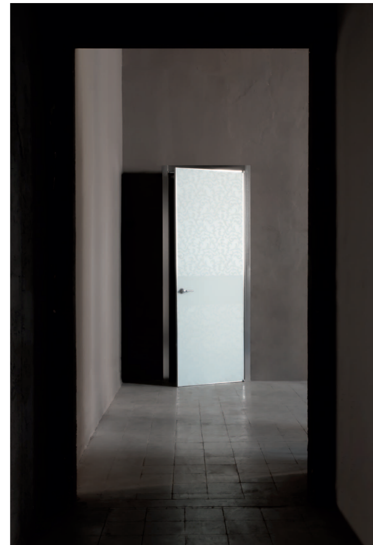
Quadra battente doppio vetro in finitura Fiandra bianco. Quadra swing door double glass in Fiandra bianco finishing. Quadra porte battante double verre en finition Fiandra bianco. Quadra Drehtür Doppelglas mit Austührung Fiandra bianco. Quadra batiente doble vidrio en acabado Fiandra bianco.