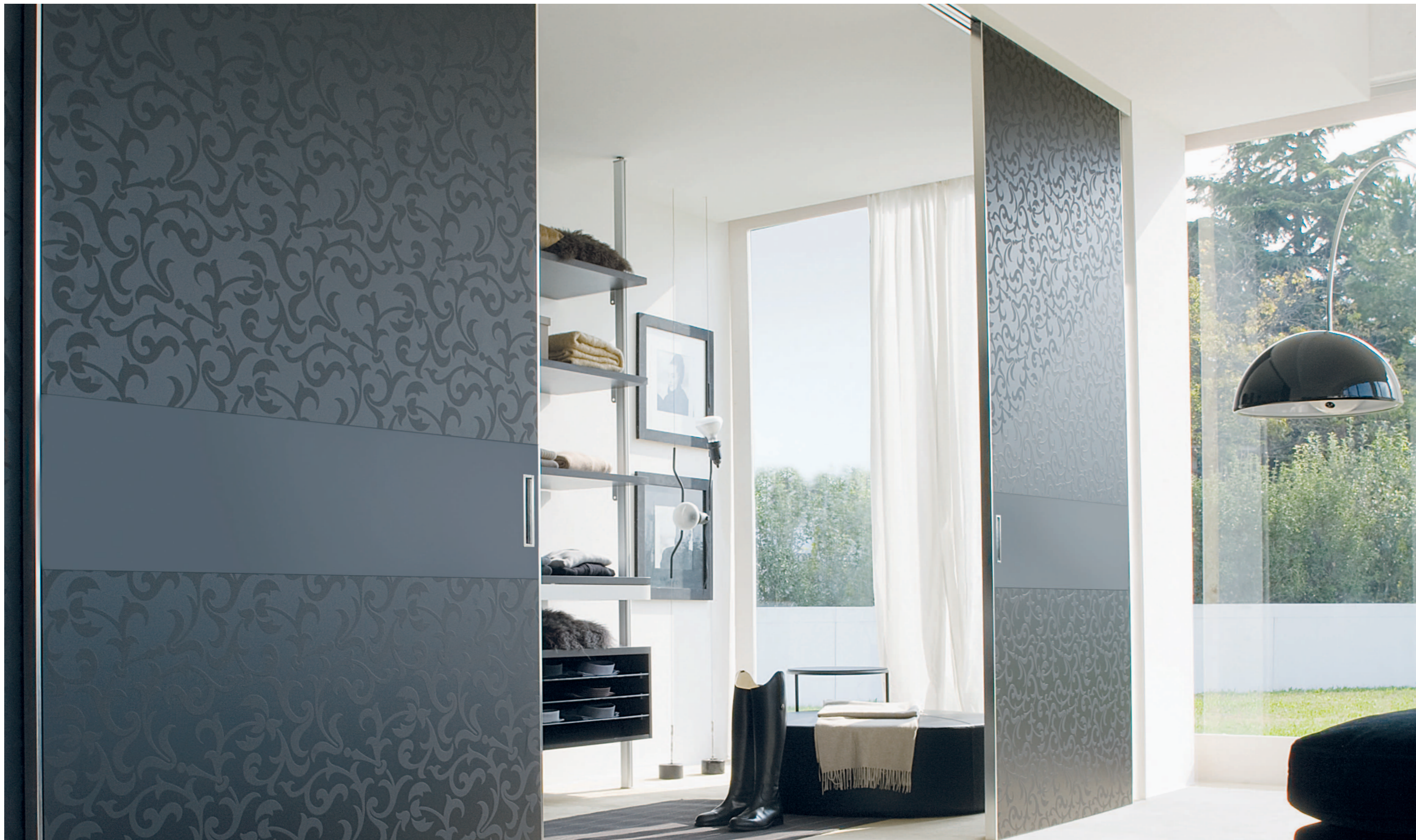
Quadra scorrevole doppio vetro con vetro serigrafato verniciato nero. Binario e profili verticali in finitura acciaio. Quadra double glass with silk-screen process black lacquered. Rail and vertical profiles in steel finishing. Quadra double verre, verre avec sérigraphie laqué noir. Rail et profils verticaux en finition acier. Quadra mit Doppelglas mit Serigraphie schwarz lackiert. Schiene und vertikale Profile in Ausführung Edelstahl. Quadra corredera con doble vidrio negro serigrafado y barnizado. Guía y perfiles verticales de acabado acero.