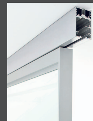
Particolare binario a soffitto 1 via Detail of 1 way ceiling rail Détail du rail au plafond 1 voie Detail der Deckenschiene mit 1 Führungsbahn Detalle de la guía de 1 vía a techo

Il binario è regolabile The rail is adjustable Le rail est réglable Die Schiene ist verstellbar La guía es regulable