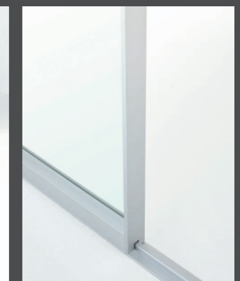
Particolare del profilo a pavimento per pannelli fissi Detail of the floor-profile for fixed panels Détail du profil au sol pour panneaux fixes Detail des Bodenprofils für feste Paneelen Detalle del perfil a suelo para paneles fijos